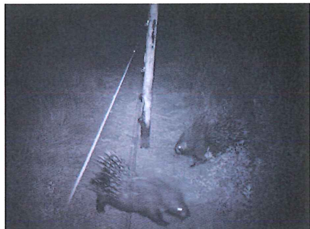
Fig. 3 - I peli, che ricoprono in modo diversificato il corpo dei mammiferi, per la loro scarsa conducibilità elettrica, rappresentano un valido sistema di difesa che attenua o annulla l'effetto delle recinzioni elettriche specialmente nei periodi asciutti