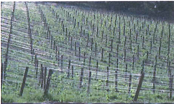
Fig. 2 - Spesso i fili delle recinzioni sono del tutto simili a quelli di sostegno dei filari dei vigneti che, non essendo elettrificati, gli animali attraversano abitualmente senza alcuna difficoltà

Il presente lavoro riassume i primi risultati di una indagine intrapresa presso il Dipartimento di Economia, Ingegneria, Scienze e Tecnologie Agrarie e Forestali dell'Università di Firenze, allo scopo di verificare, attraverso il rilevamento video fotografico automatico, l'effettiva efficacia di sistemi di protezione delle colture che si prestano ad essere adottati in contesti diversi; in particolare è stato monitorato il comportamento di ungulati selvatici nei confronti di recinzioni elettrificate fisse, realizzate secondo schemi sperimentali di vario tipo, e di dissuasori ottico-acustici automatici.