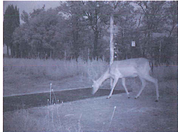
Fig. 6 – Le immagini riprese in corrispondenza delle griglie per il passaggio dei veicoli mostrano che queste hanno rappresentato un ostacolo efficace per impedire il passaggio del daino