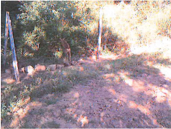
Fig. 4 – Numerosi rilievi testimoniano l'attraversamento delle recinzioni, da parte di cervidi, saltando tra i fili

Più frequentemente però il passaggio si è verificato utilizzando il primo spazio più ampio tra i fili quando le distanze fra i vari ordini degli stessi non erano costanti. Ciò può suggerire l'opportunità di approfondire le indagini per verificare se tali zone di "passaggio preferenziale", attrezzate con fili attivi e fili terra alternati, siano in grado di aumentare l'efficacia della recinzione;