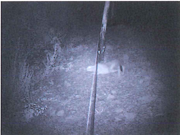
Fig. 5 – Il videotrappolaggio ha consentito di verificare che, dopo un breve periodo di indecisione, la lepre attraversa quotidianamente e senza esitazione le recinzioni elettriche